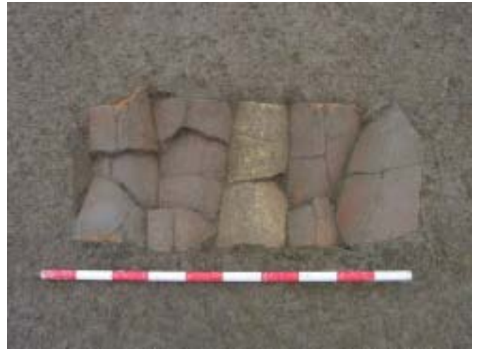
Fig. 5. Cubierta de tejas enteras perteneciente a una tumba infantil de rito islámico en la vega del río Jarama (La Huelga, Barajas, Madrid)

Por la otra vertiente, la de los grandes cementerios de poblados con ocupación plurisecular, las fases avanzadas (del siglo VII d.C. en adelante) presentan no ya sólo graves problemas de reconocimiento y datación (CONTRERAS, VIGIL-ESCALERA, e.p.) sino de indeterminación en general. Pero la ausencia de bienes personales que acompañen al difunto puede suplirse parcialmente a partir de la efectiva variabilidad de tipos constructivos y por los materiales utilizados en la construcción (la inversión efectiva amortizada en la parte del sepelio que pervive en el registro arqueológico). De este modo vemos cómo en las sepulturas más humildes, las fosas simples se cubren con tabla de madera mientras que las más costosas hacen una utilización profusa de grandes lajas de piedra en paredes, solados y cubierta, tratando de emular en lo posible los sarcófagos monolíticos de los estamentos más poderosos de la sociedad y la época.