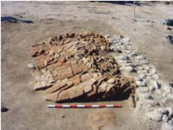
Fig. 4. Apilamiento de tejas listas para su reaprovechamiento. Proceden de un contexto altoimperial romano de abandono (Pelicano, sector 1) datado en la segunda mitad del siglo I d.C.