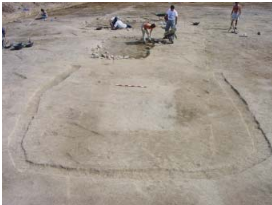
Fig. 2. Cabaña compleja de formato subrectangular, provista de roza perimetral exterior (Pelicano, sector 1), datada en el siglo VI d.C. El ambiente Norte, en primer plano, dispone de una estructura de suelo rehundido y planta rectangular en su interior

cuenca sedimentaria o en las vegas de los ríos. La zona serrana, en la que abunda la piedra, resulta mucho peor conocida, aunque parece lógico que se reduzca el número de casos de estructuras excavadas (o simplemente desaparezcan) a expensas de una utilización masiva de la piedra como material constructivo.