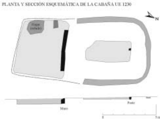
Fig. 3. Esta cabaña ejemplifica la complejidad que comienza a intuirse en lo relativo a los tipos constructivos de la arquitectura doméstica altomedieval. El estado de conservación del yacimiento influye de forma decisiva en el reconocimiento de nuevas morfologías

En La Indiana (Pinto) pudo comprobarse el saqueo altomedieval de una construcción de época altoimperial romana por medio de trincheras de expoliación y el uso sistemático de sus ruinas como cantera de piedra y quizás teja. En este caso resulta claro que no se pudo dar una reutilización de espacios abandonados (puesto que hay un abandono persistente y continuo del lugar durante casi tres siglos entre ambas ocupaciones), fenómeno que puede no verse con tanta nitidez en muchos otros yacimientos con fases tardorromanas. Resultaría interesante comprobar hasta qué punto el fenómeno no pocas veces descrito de reocupación de una villa romana por un cementerio o poblado de época visigoda no esconde en realidad la elección del lugar en función de la disponibilidad de materiales de construcción reprovechables por el nuevo asentamiento.