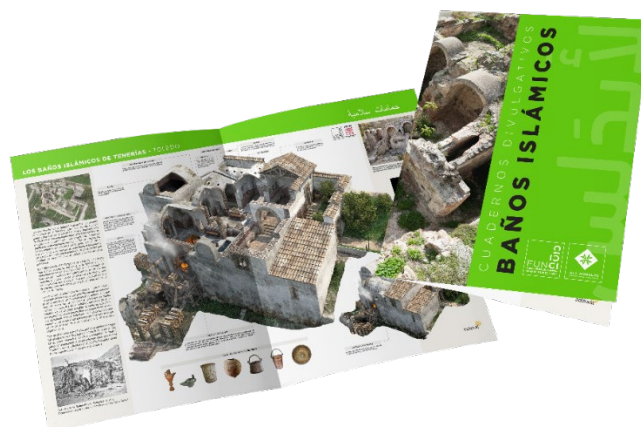
Fig. 2. Modelo de cuaderno divulgativo para la tipología de baños islámicos.

En cuanto a la difusión de algunas tipologías presentes en el conjunto de la herencia andalusí, trabajamos en la producción de una serie de cuadernillos divulgativos que próximamente se publicarán y en los que se explicarán de forma didáctica elementos como las mezquitas, los baños, las atalayas o las alquerías, entre otros, gracias a los trabajos de documentación gráfica y textual que se desarrollan por la fundación y sus colaboradores (Fig. 2). El objetivo es poder tipificar elementos que trasciendan también los inmuebles y lo material, acercándonos al público por diversas vías.